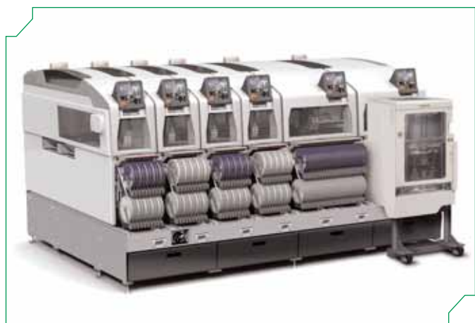
Рис. 1 Автомат поверхностного монтажа NXT

В NXT реализован принцип параллельной сборки печатных узлов. Автомат собирается из отдельных модулей (рис.3), которые монтируются на специальную базу (рис.4).