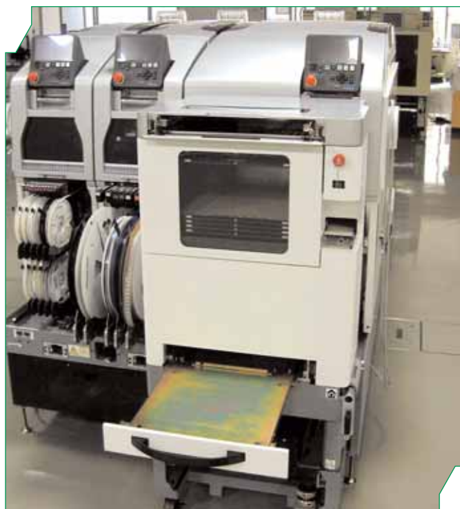
Рис.8 Питатель из поддонов L-типа

И это не предел. Максимальная производительность NXT зависит от конфигурации автомата – от того, сколько используется модулей и какими именно установочными головками они оснащены. Производительность установочных головок составляет от 3500 (H01) до 17000 (H12) комп./ч.