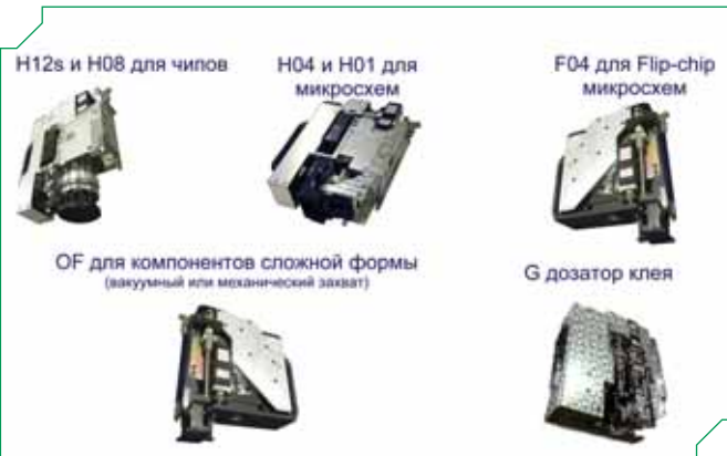
Рис.5 Варианты установочных головок

Набор печатных плат, с которыми работает автомат, тоже широк: