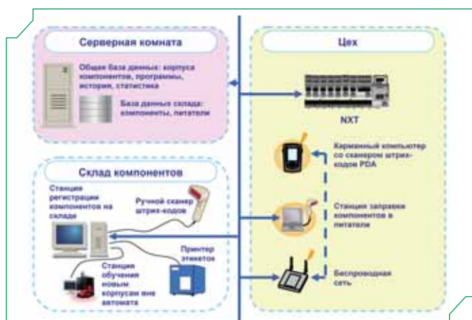
Рис. 2 Структура автоматизированной системы FUJI NXT