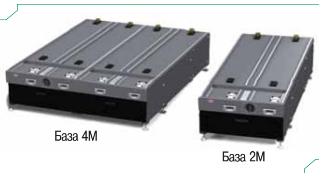
Рис.4 Базы автомата поверхностного монтажа NXT