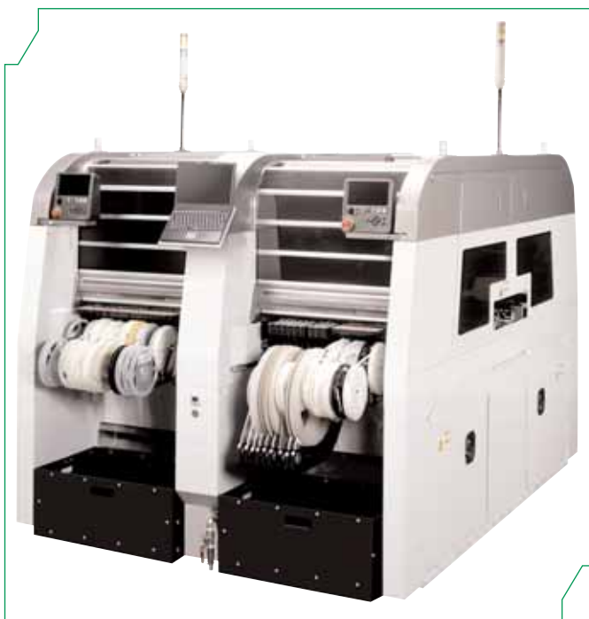
Рис. 10 Автомат поверхностного монтажа FUJI AIM

на переналадку; предупредить остановку автомата из-за окончания ленты или поломки питателя; производить техническое обслуживание узлов, в том числе и установочных головок, без полной остановки автомата и многое другое. Нельзя забывать, что чем выше реальная производительность, тем меньше срок окупаемости оборудования.