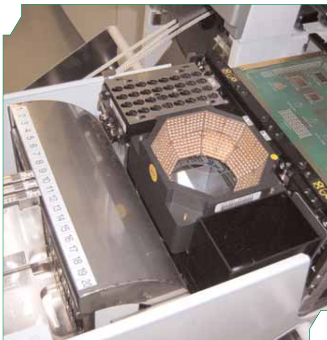
Рис. 9 Компактное расположение питателей, камер СТЗ, станции смены захватов и платы