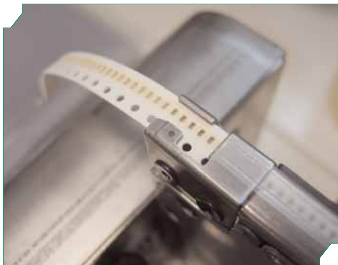
Рис.7 Реперный знак на питателе и перфорация ленты для корректировки места забора компонента

Высокая точность автомата NXT соответствует всем современным требованиям. Более того, новая установка еще долгие го-